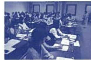
グリーンコープ生協ひろしま(地域福祉全体会主催)の福祉講演会の様子

今年度は、支部ごとに助成団体報告会を開催し、活動内容を報告しました。福祉活動組合員基金の更なる広がりを実感できる1年でした。 (基金運用委員会)