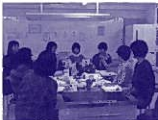
西支部南部地区委員会