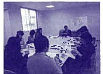
福山支部東部地区委員会