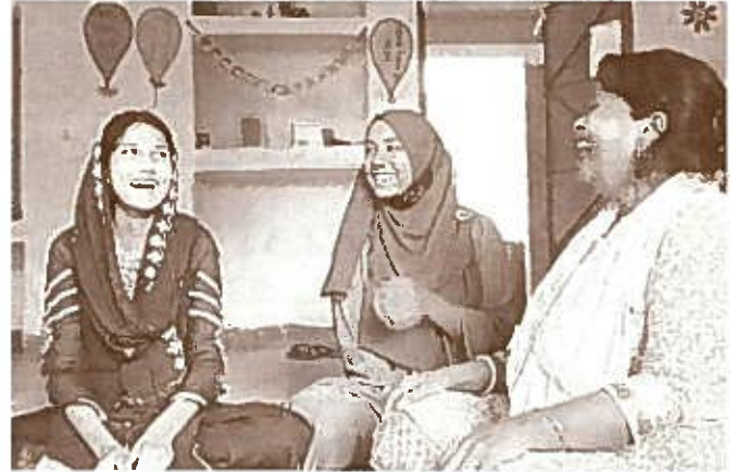
楽しくおしゃべりする少女たちと先生