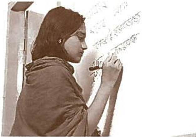
支援センターで学ぶ少女

シャプラニール・ステナイ生活キャンペーンにご協力いただきありがとうございます。シャプラニールは、市民の立場から貧困のない社会を実現するために活動している団体です。ご寄付いただいた品物について、シャプラニールからの報告です。今後ともご協力をよろしくお願いいたします。