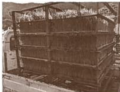
稲の苗がこんなに たっぷり!!

尾道市御調町にて、農業体験第1回目を行いました♪ たくさんの方から参加の申し込みがあり、やむを得ず抽選となりました。今回参加できなかった皆様、大変申し訳ありませんでした。 当日の様子をお知らせします♪