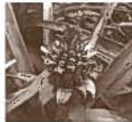
紫の可愛い花が咲きます。