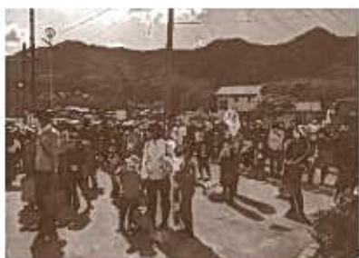
まずは皆さんに 今日の流れを説明。