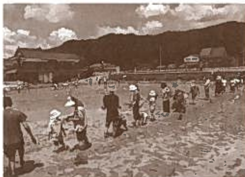
広～い田んぼに並んで 一斉に田植えスタート!