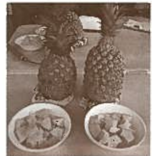
ピーチハインは果肉が白いのにびっくりしました！！白い果肉と桃に似た香りが特徴です♪