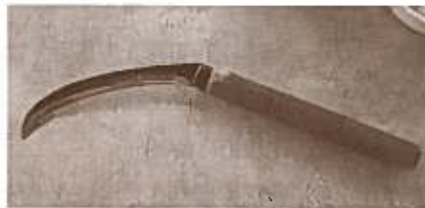
パイナップル専用のカマです。

甘さは収穫した時に決まってしまうので、収穫する時が一番緊張すると言われていました。 届いたらすぐ食べるようにしてくださいね(#.#)