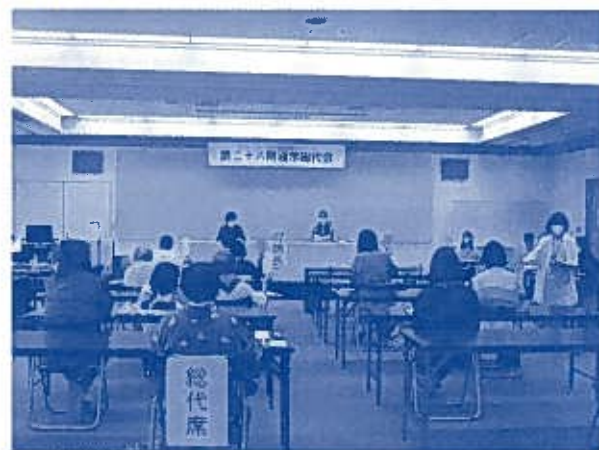
総代会は、グリーンコープ生協の組合員の代表である総代が出席し、生協の活動や事業の報告を行い、2020年度の方針などを決める大事な決定機関です。