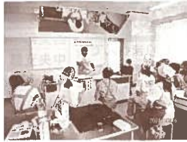
北部地区グリーンわいわいカフェの様子

グリーンわいわいカフェ「秋川牧園の鶏肉を食べよう」です。こだわりの鶏の育て方と、「秋川牧園特製鶏のから揚げ」の作り方を教えていただきました。